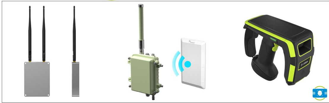
几种常见的全向读卡器外观